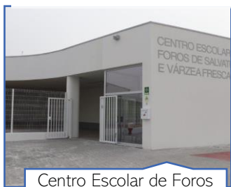
Centro Escolar de Foros de Salvaterra e Várzea Fresca