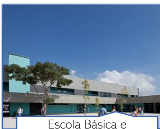
Escola Básica e Secundária de Salvaterra de Magos