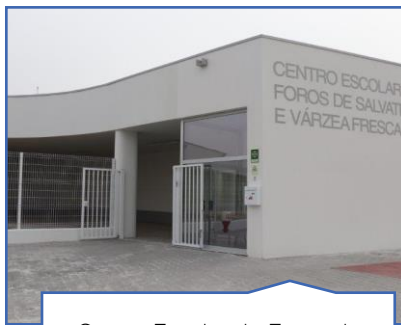
Centro Escolar de Foros de Salvaterra e Várzea Fresca

Agrupamento de Escolas de Salvaterra de Magos